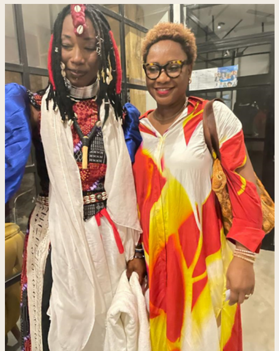
Fatoumata Diawara: Chanteuse malienne – compositrice et survivante des MGF

La Caravane, qui traversera les frontières avec le livre “Dear Daughter” à bord collectant des milliers de signatures au fur et à mesure, qui attirera une couverture médiatique nationale et internationale.